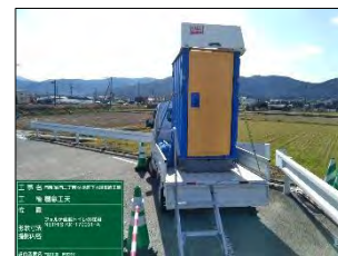
移動式車載トイレカー