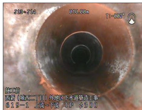
着 手 前